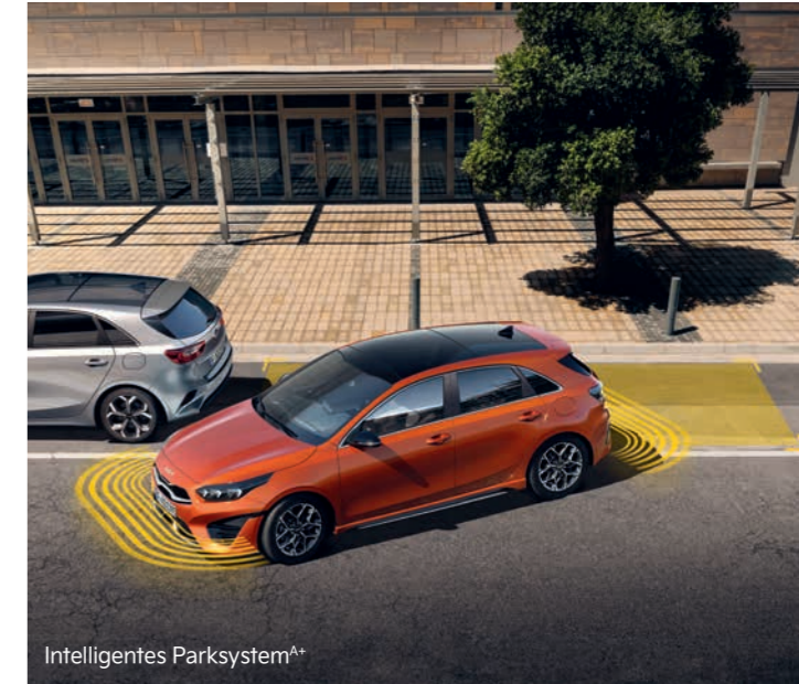
Intelligentes Parksystem A+

* Je nach gewählter Ausstattungslinie teilweise nicht verfügbar, gegen Aufpreis erhältlich oder serienmäßig.