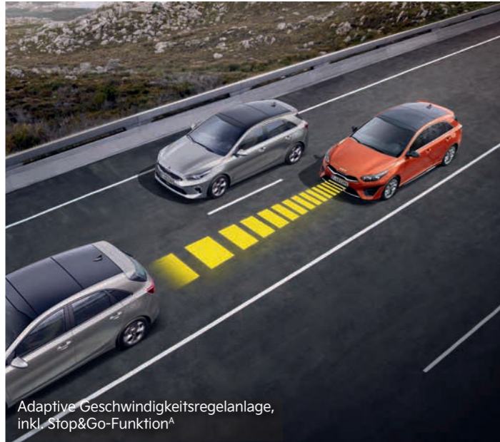
Adaptive Geschwindigkeitsregelanlage, inkl. Stop&Go-Funktion A

Mit einem breiten Spektrum an aktiven Sicherheitssystemen A unterstützt dich der Kia Ceed Sportswagon Plug-in Hybrid dabei, in Gefahrensituationen schnell und angemessen zu reagieren.