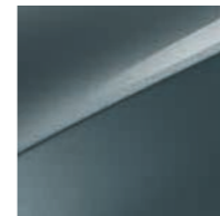
Yucca Stahlgrau Metallic (USG)