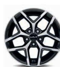
17-Zoll-Leichtmetallfelgen (optional für Platinum)

Bei einigen unserer modernen Metallicfarben werden bewusst unterschiedliche Farbpigmente verwendet. Dadurch können unter bestimmten Lichtverhältnissen, z.B. direktes Sonnenlicht, attraktive Farbeffekte erzielt werden. Zum Teil kann die Farbe changieren, z.B. von Schwarz zu Dunkelblau. Bei den hier abgebildeten Farbdarstellungen kann es aufgrund der Drucktechnik zu Abweichungen zu den Originalfarben kommen. Weitere Informationen zu den Farbeffekten und Grundfarben erhältst du bei deinem Kia-Partner. Metalllackierungen sind aufpreispflichtig.