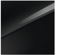
Zilinaschwarz Metallic (1K)