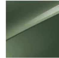
Experience Grün Metallic (EXG)