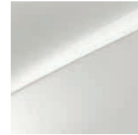
Deluxeweiß Metallic (HW2)