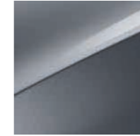
Lunarsilber Metallic (CSS)