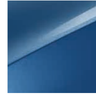
Blue Flame Metallic (B3L)