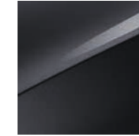
Pentametal Metallic (H8G)